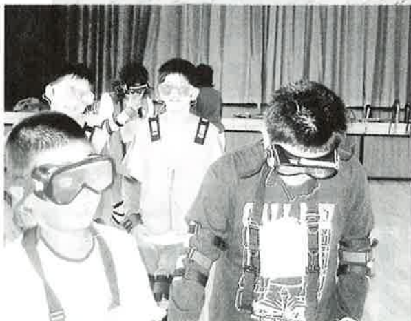
ゴーグルをつけると、見えにくいね

10月11日(火)と14日(金)、飯岡小学校6年生が総合学習の一環で福祉学習のため飯岡保健福祉センターを訪れました。児童たちは車椅子の体験をしたり、疑似体験セットを身につけたりした後、デイサービスに来ているお年寄りたちといっしょにすごろくなどのゲームを楽しみました。