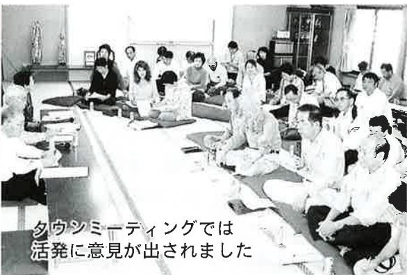
タウンミーティングでは活発に意見が出されました。

9月30日(金)、広原東区民館で広原地区社協により、10月13日(木)には共和地区社協により共和小学校体育館で生活圏タウンミーティングが開催されました。