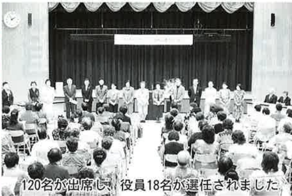
120名が出席し、役員18名が選任されました。

10月18日、市内のボランティアグループ44団体が参加し旭市ボランティア連絡協議会設立総会が開かれました。新生旭市となり新たな一つの地域として、グループ間の情報交換、相互協力を通して各グループ活動の推進を目的としています。当日は18名の役員が選出され約800名のネットワークづくりが始まりました。自由・正義・勇気を意味したボランティアという言葉掲げ「旭市ボランティア連絡協議会」が発足されました。