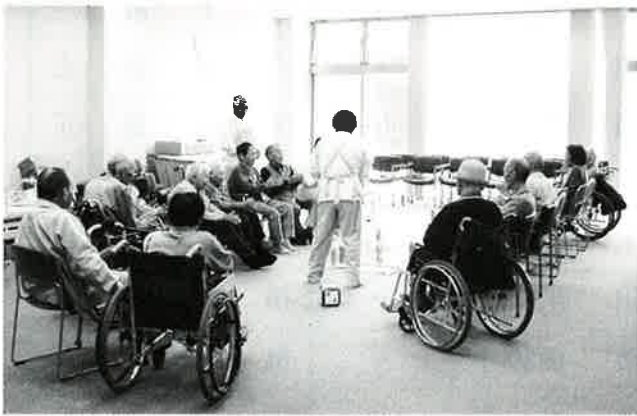
デイサービスでゲームを楽しむ利用者さん