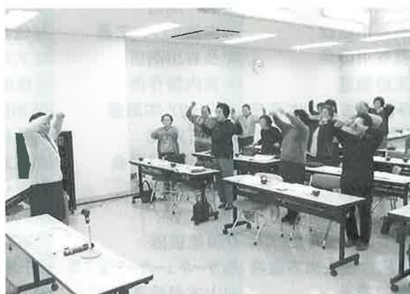
△音楽に合わせて健康体操、イチ、ニ、サン、シ

介護予防教室は全3回の開催で、講義の1回目は「介護予防」で、講義の2回目は「認知症と予防と地域で支える」についての内容でした。実技では「365歩のマーチ」の音楽に合わせて、いきいき健康体操を行いました。