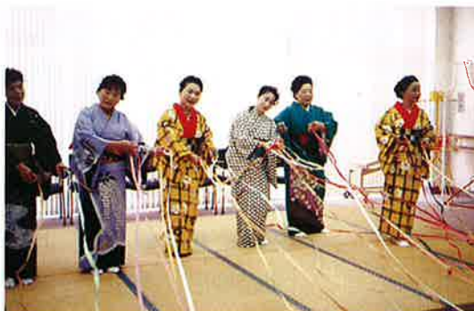
あざみ会さんは、見事な踊りで好評でした。(12月16日)

る機会が少ないとのことで、デイサービス利用者の皆さんは毎年楽しみにしており、今回も大変喜ばれ、感動で涙を流される方もおられました。