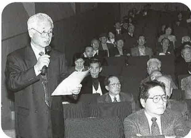
意見交換も活発でした。

平成18年2月22日、東総文化会館大ホールで海匝地区タウンミーティングが開催されました。当日は、海匝地区全域から540名の参加者があり、県からの千葉県高齢者保健福祉計画案についての説明の後、医師、地区社会福祉協議会、ボランティア、老人クラブ、NPOなどの方々によるシンポジウムや参加者からの意見発表が行われました。