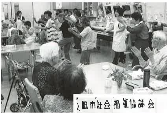
旭市社会福祉協議会

8月19日に、旭市社会福祉協議会通所介護事業所（デイサービス）の夏祭りを開催しました。当日は、素敵な笛の音を聞き、大漁節を踊り楽しいひと時を過ごしました。