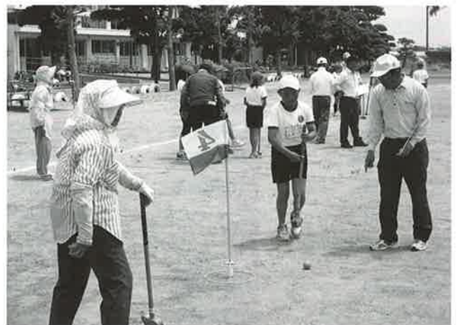
6月10日に豊畑小学校で世代間交流会の様子です。当日は総勢50名の参加があり、グラウンドゴルフを通して楽しく交流をしました。

現在ボランティア、区長、民生委員・児童委員、保護司、保健推進員、老人クラブ、赤十字奉仕団からなる36名の委員によって組織され活動を展開しております。主な事業として、高齢者地域ふれあい交流事業、一人暮らし高齢者訪問活動、防犯パトロール、学校関係行事への参加など幅広く事業を展開しております。