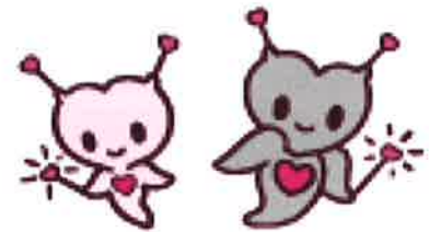
キャラクターのチエンジェル(左)とピックリオネ(右) 流水の天使クリオネがモチーフです。