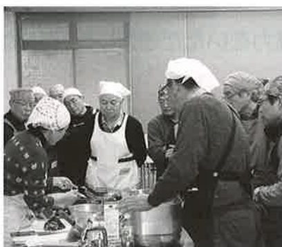
普段は目分量なんだけどなあ。分量をしっかり守りグループで協力して美味しい料理を作りました。

2月4日に男の料理教室を開催しました。当日は16名の参加があり、おいしい料理を作りました。