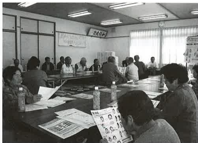
10月27日に江ヶ崎コミュニティセンターで開催された地域ふれあい交流事業の様子です。当日は49名の参加があり、楽しい一日を過ごしました。

今後とも、旭嚶鳴地区の皆様とともに歩める旭嚶鳴地区社会福祉協議会として活動予定です。