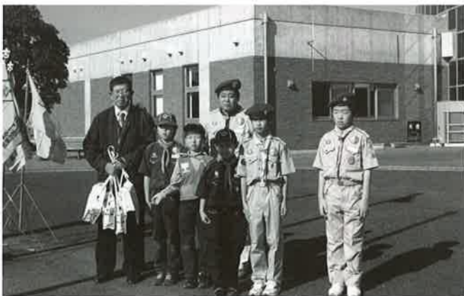
12月1日に、ボーイスカウト旭第2団より歳末助け合い街頭募金を本会協会長に贈呈いただきました。

ちばみどり農業協同組合 旭市役所 総合病院国保旭中央病院 社会福祉法人旭市社会福祉協議会