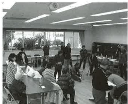
何点だった?レクリエーションでスカットボールと輪投げを実施し、楽しく交流しました。

当日は健康講話、会食会、レクリエーションが開催されました。合計41名の参加があり、楽しく会食を実施しました。