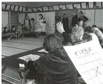
〇番あった?役員さんの手作りのビンゴゲームに参加者も一喜一憂し、楽しく交流しました。