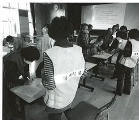
「ボランティアさんは受付をして下さい」職員もスムーズに受付できるよう訓練を実施しました。

本会では、東日本大震災時3月16日から31日まで開設し、延べ570件のボランティア依頼に対し延べ7,608名のボランティアを受け入れました。