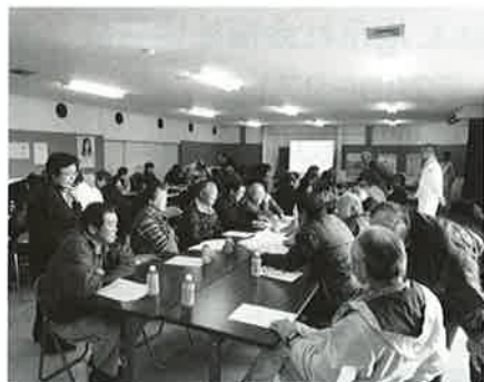
「あそこに逃げたらよかっぺ。」地区ごとに活発な意見交換を実施しました。

体験し、話を聴いてくれないことの辛さ、話を耳を傾けて聴いてくれることの嬉しさなどを体験しました。 今後とも、傾聴ボランティア講座を継続的に開催を予定します。是非ひたすら無視する体験をして感じてみてはいかがでしょうか？