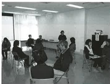
意地悪をしているのではないのです。話しかける相手をひたすら無視する体験を実施しました。

「こちらの聞きたいこと」を聞く(Hear)のではなく、「相手の言いたいこと、伝えたいこと、願っていること」を受容的、共感的態度で「聴く」(Listen)ことであり、相手が自分自身の考えを整理し、納得のいく結論や判断に到達するよう支援することです。相手の心を癒し、孤独感や不安が軽減して安心感につながります。