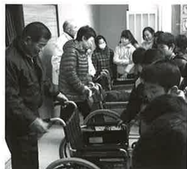
「へえ〜。車椅子って簡単にたためるんだ〜あ」 車椅子体験をする三川小学校4年生

高齢者疑似体験では、重りや関節が曲がりにくくなるサポータ、白内障を体験できるゴーグルを身に付け階段の上り下りを体験、車椅子操作体験では、車椅子のたたみ方や、段差やスロープの上り降り、実際自分でこいでドアを開ける体験を実施しました。 生徒さんは興味津々ながら