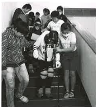
「重い!動けない!」 高齢者疑似体験をする飯岡小学校6年生

2月4日に飯岡小学校6年生52名、2月17日に三川小学校4年生37名を対象に、高齢者疑似体験、車椅子操作体験の出張講座を実施しました。