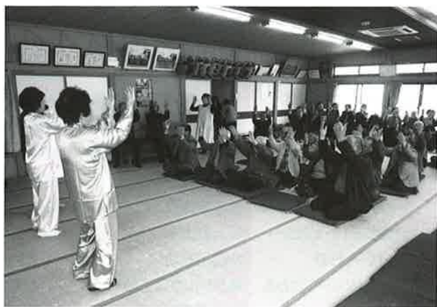
2月22日に広原東区民館で開催された高齢者健康増進ふれあい会食会の様子です。当日は68名の参加があり、委員さんによる太極拳などのプログラムに、参加者の笑顔あふれる楽しい会食会となりました。

今後とも、広原地区の皆様とともに歩める広原地区社会福祉協議会として活動予定です。