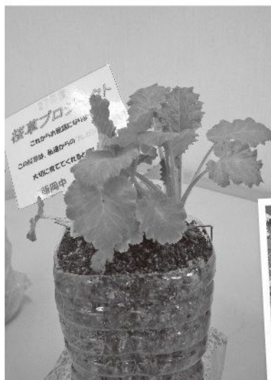
空いたペットボトルに苗木を植えてきてくれました。