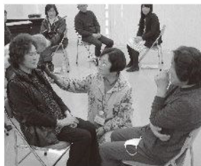
実際に二人一組になり、話し手、聴き手に分かれてのロールプレイをおこないました。