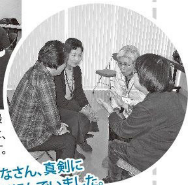
みなさん、真剣に取り組んでいました。