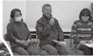
講義の後は、参加者で輪になり自己紹介をしました。