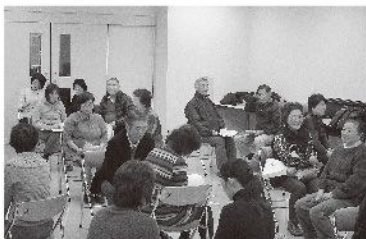
話しかけている相手をひたすら無視をする体験をしました。無視をされるって、思っている以上に悲しい気分になります。