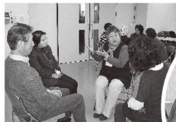
初対面の人とのロールプレイは最初緊張したようですが、時間と共に、みなさんすっかり馴染んだようです。