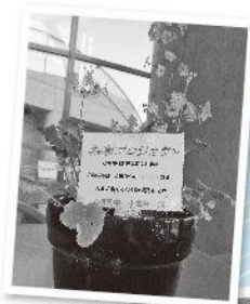
今は可愛いピンクのお花を咲かせています。