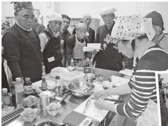
参加者のみなさんは真剣に講師の先生の説明を聞いていました。

来年度も引き続き開催を予定していますので、興味のある方は是非ご参加ください。日程など決まり次第、広報やホームページでお知らせします。