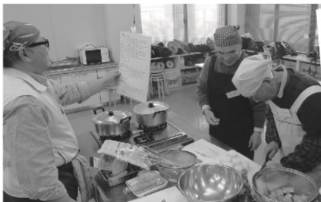
まずは、念入りに手順をチェックします。

19名の参加があり5グループに分かれて調理しました。今回のメニューは、ぶり大根、のし鶏、茶わん蒸し、辛し和え、具だくさんごま風味みそ汁と、品数が多いにも関わらず、皆さん手際よく調理されていました。茶わん蒸しは鯉節と昆布でだしを取るところから調理するなど本格的でした。