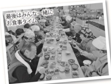
最後はみんな一緒に お食事タイム

来年度も男の料理教室は開催予定です。開催時期等はホームページでお知らせします。料理初心者も大歓迎です!ご興味のある方は是非ご参加ください。