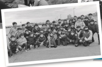
寒いなかでの活動お疲れさまでした!