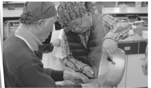
息を合わせて協力して仕上げます。