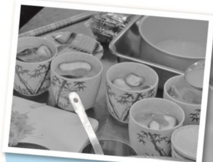
器に卵を流し込んで出来 上がり、見た目はプロ並?!