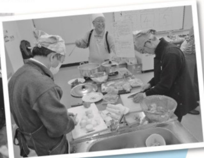
グループで分担して 作業開始!