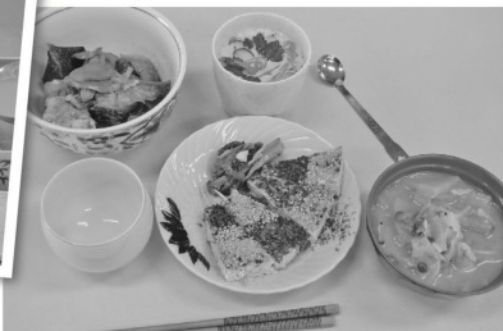
品数豊富!おいしそうに出来上がりました。