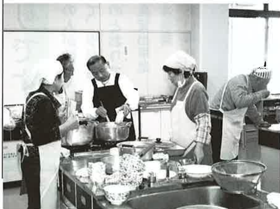
△3/1に行われた料理教室から

男の料理教室参加者 ひとり暮らしや高齢者世帯の増加に伴い、男性が食事を作る機会も多くなっています。旭市社会福祉協議会では、男性を対象とした料理教室を開催します。