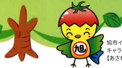
旭市イメージアップ キャラクター 【あさピー】