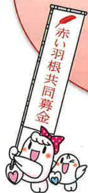
共同募金キャラクター 【愛ちゃん、希望くん】

10月1日から 「赤い羽根共同募金運動」 12月1日から 「歳末たすけあい募金運動」