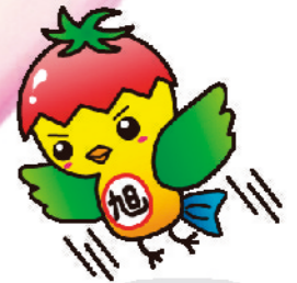
旭市イメージアップキャラクター 「あさビー」