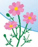
小さな親切運動 シンボルフラワー 【コスモス】

「できる親切はみんなでしょう」それが 社会の習慣になるよう活動しています。 「小さな親切」実行章の推薦、作文コンクール、 その他の身近な活動等