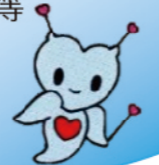
小さな親切運動 キャラクター 【ピクリオネ】