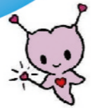
小さな親切運動 キャラクター 【チエンジェル】