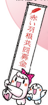
共同募金キャラクター 【愛ちゃん、希望くん】