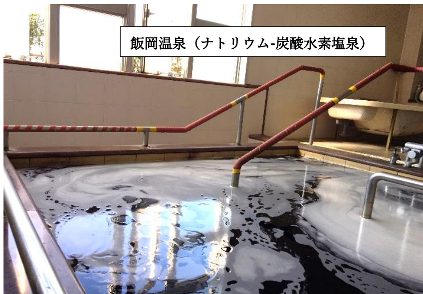
飯岡温泉 (ナトリウム-炭酸水素塩泉)